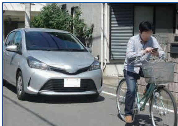
ながら運転の自転車には要注意

また、交差点では信号無視や一時停止不履行による飛出しも多く見受けられます。自転車は「交通ルールを守らず出現する可能性がある」という前提で、その挙動を常に予測することが重要です。