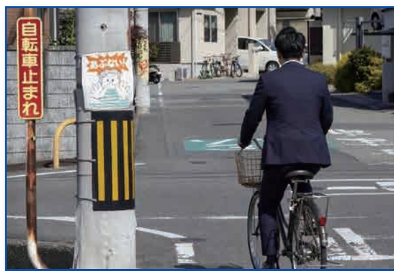
自転車の停止を期待せず、主体的な安全確保を

また、交差点では自転車の停止を期待せず、「構えブレーキ」を基本とした慎重な進行を心がけましょう。「相手がルールを守るはず」という思い込みを排し、自動車側が主体的に安全を確保する運転が求められます。